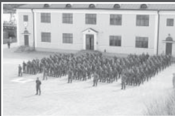
Basskyddskompaniet uppställt på Linje 7 i avvaktan på avlämning till Bataljonchefen.