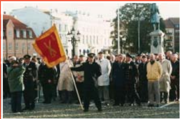
Kamratföreningen uppställd med sin fana.