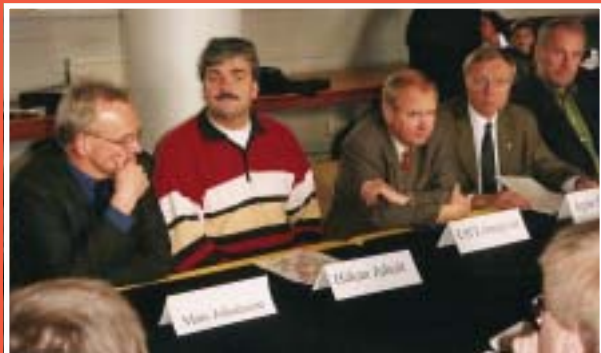
Politiker besöker Rosenholm inför Riksdagsbeslut.