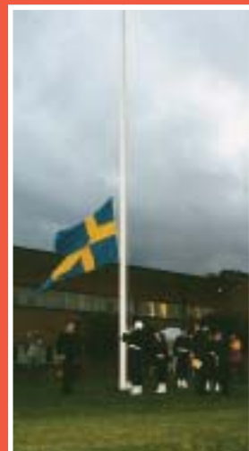
Örlogsflaggan halas för sista gången vid KA2.