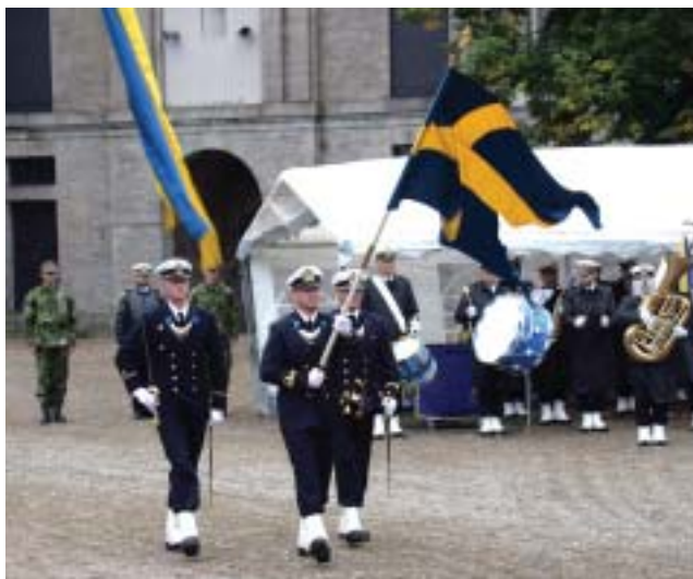
Flaggvakten marscherar in