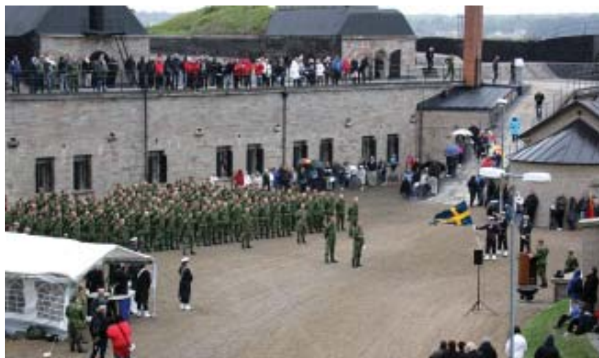
Batljonen uppställd för korum