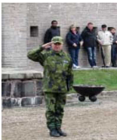
Tjff C MarinB hälsar truppen