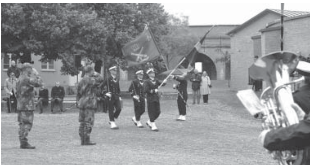
Soldaterinran är genomförd och flaggvakten passerar KA 2 regimentsfana