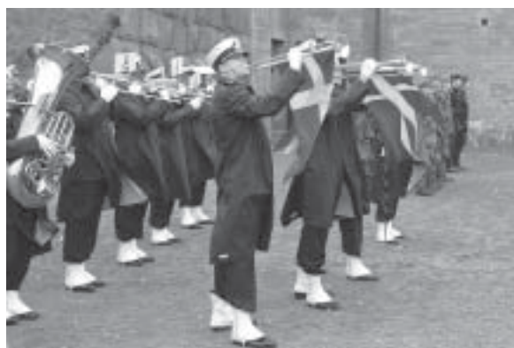
MMK spelar Carolus Rex