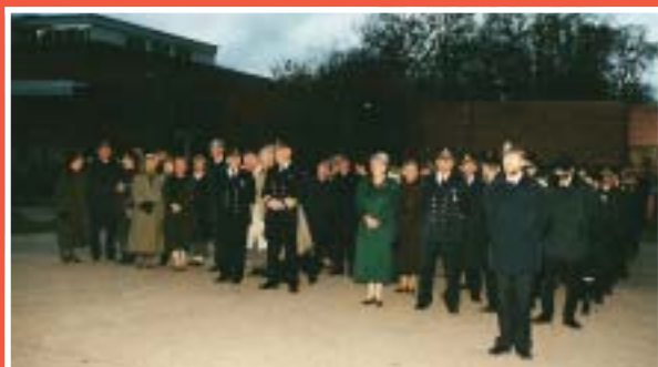
Personalen och övriga åskådare har just upplevt KA2: nedläggning.