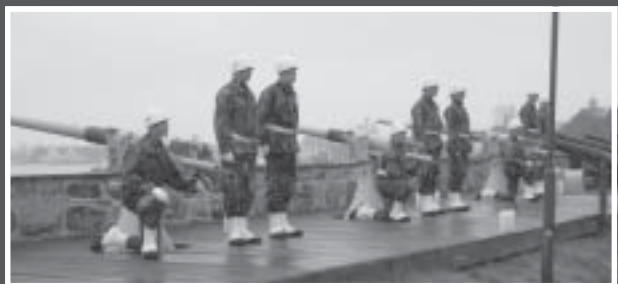
Saluterna "duggar tätt" under sommarhalvåret. Den 8 augusti hyllas vår Drottning på namnsdagen. Salutbemanningen denna gång utgörs av Grundutbildningsbataljonens manskap med förstärkning från Blekingegruppen.