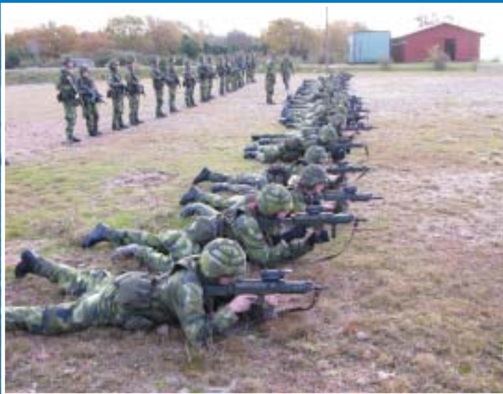
Vapenutbildning på "löpande band".