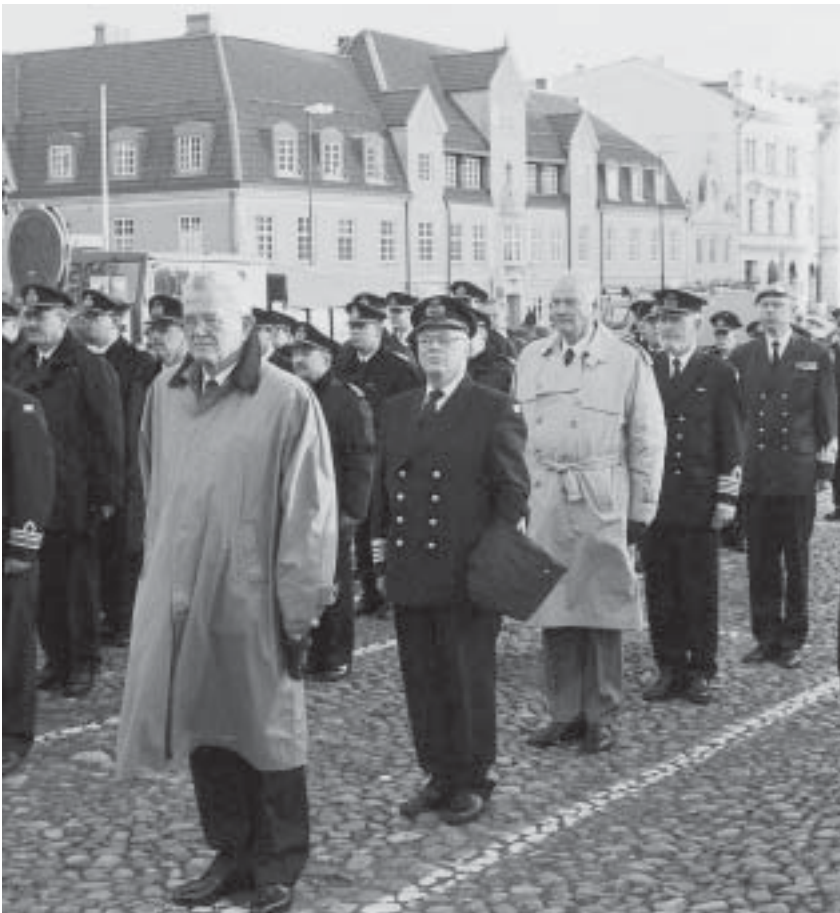
Regementschefer på rad. Bild från Stortorget

Den korta tid jag hade som chef för Karlskrona Kustartilleriregemente och för andra Kustartilleribrigaden har för alltid förändrat mig. Hade jag vetat i förväg, vad som väntade, hade jag tackat nej, men nu i efterhand är jag tacksam för de upplevelser, jag fått ta del av. Jag hoppas och tror, att jag utvecklats och att de erfarenheter jag nu bär på skall komma till nytta. Jag skulle helst av allt velat vara den förste i stället för den siste chefen för detta fina och anrika regemente. Tack för allt.