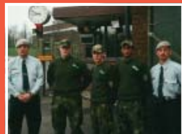
Vaktavlösning i vaken Rosenholm