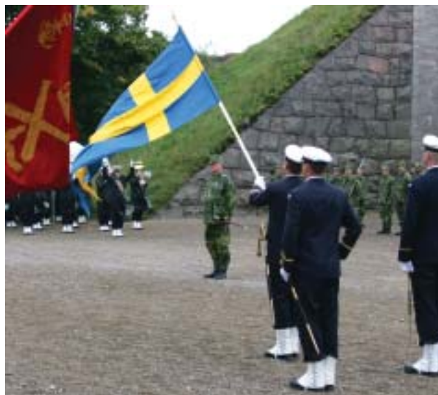
Flaggvakten på plats, KA 2 fana och fortchefen