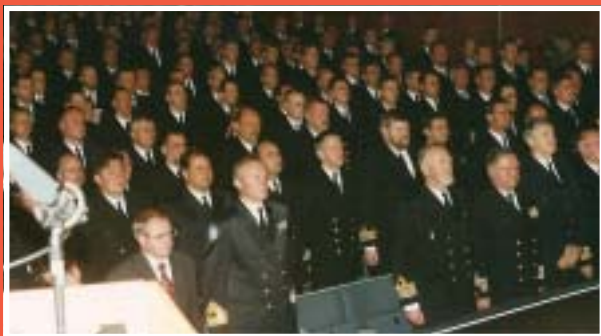
KA 2 personalen samlad i Karlskrona Konserthus.