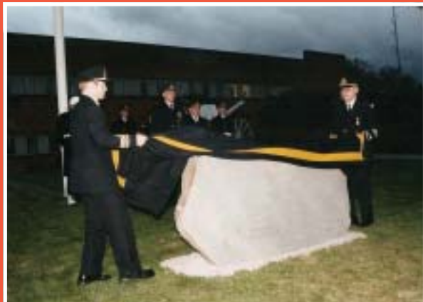
Minnesstenen avtäckts på Rosenholm