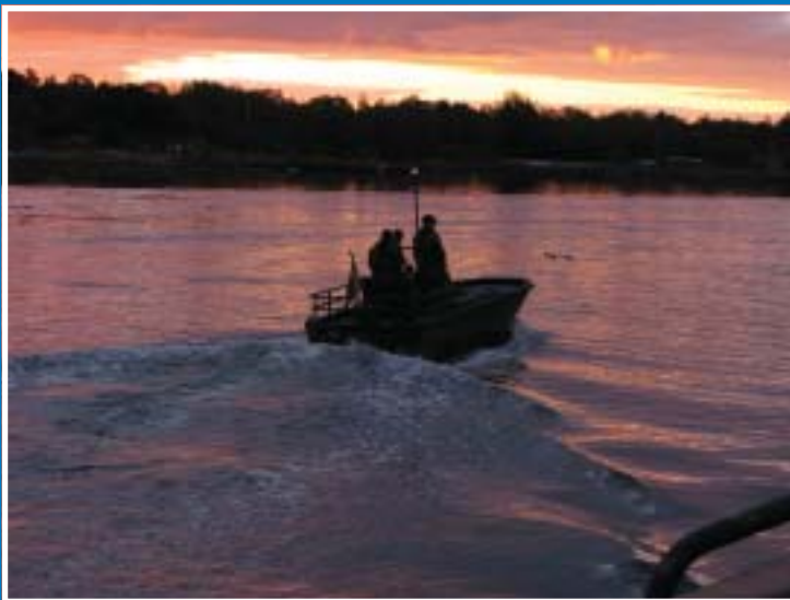
G-båtsutbildning genomfördes under hösten. Här en stämningsbild utanför Kungsholmsfort.