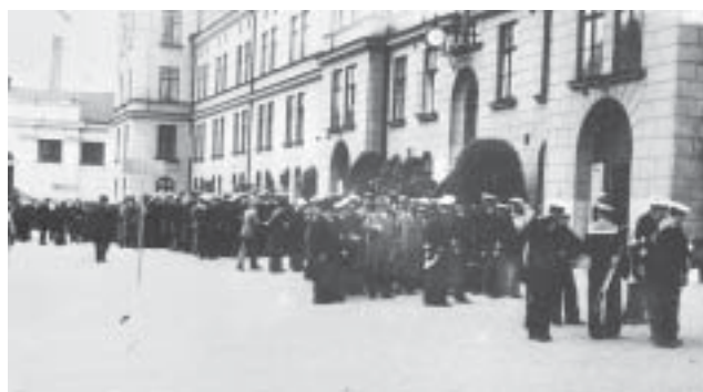
Vallgatan den 20 juni 1936. Kamratföreningen bildas