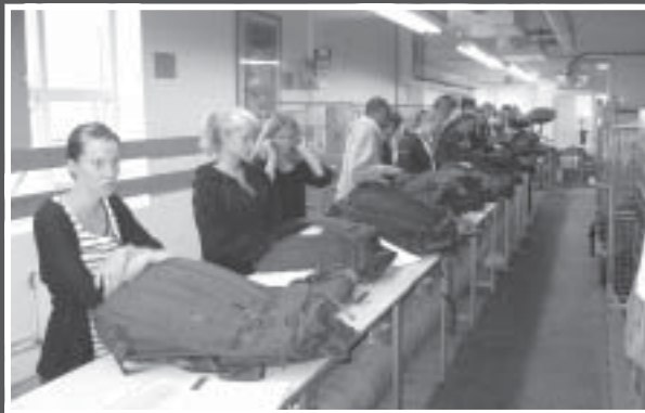
Den 2 augusti var det dags för den första "frivilliga" inryckningen till Marinbasen. Här ses våra rekryter hämta ut sin personliga utrustning på "Gula"